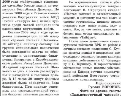
27 марта - 200 лет Внутренним войскам МВД России

Полковник Руслан ВОРОНОВ.