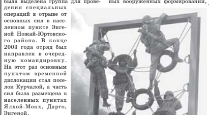
27 марта - 200 лет Внутренним войскам МВД России

В 2010 году личный состав отряда «Тайфун» принимал участие в проведении специальной операции на территории Республики Дагестан. В ходе проведения операции отрядом выполнены 44 боевые задачи, обнаружены и уничтожены семь объектов незаконных вооруженных формирований,