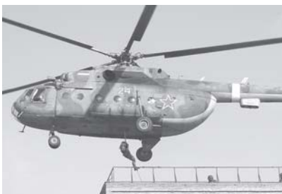
Иван ВАСИЛЬЕВ. Фото из архива газеты «Дальневосточный часовой» и Олега СУВОРОВА.

Продолжаем улучшать бытовые условия офицеров и солдат. В прошедшем году отремонтировано и введено в эксплуатацию 6 столовых, отвечающих всем современным требованиям. В отряде специального назначения