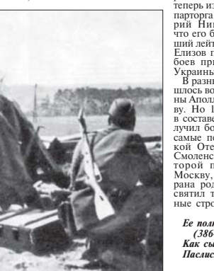
Солдаты в окопах во время боя

но и смысл. Это государство начало славиться не виной людей, которые писали эти слова, почасом может быть, и само, топорно, но так же верно, как топор рубит дерево». Так вот написать (имею в виду это «пара Аполлинарий») истинный забайкалец и воин, вышедший на своих плечах страшно