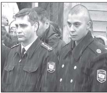
Твои герои, Россия

сибирских регионов. Парламент и губернатор Зabayкальского края направили письмо министру обороны РФ. Столь мощный призыв не мог быть не услышанным и 16 ноября Президент России Д.Медведев подписал Указ о присвоении звания