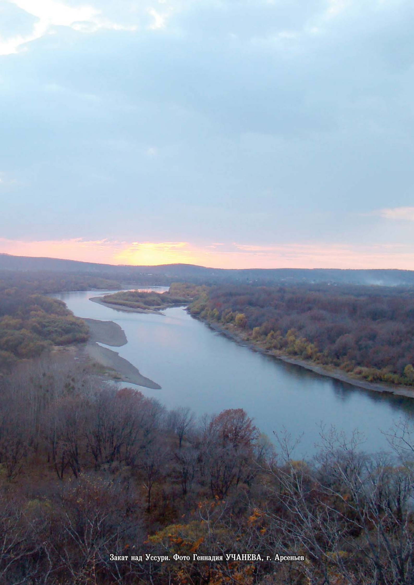
Закат над Усури. Фото Геннадия УЧАНЕВА, г. Арсенъев