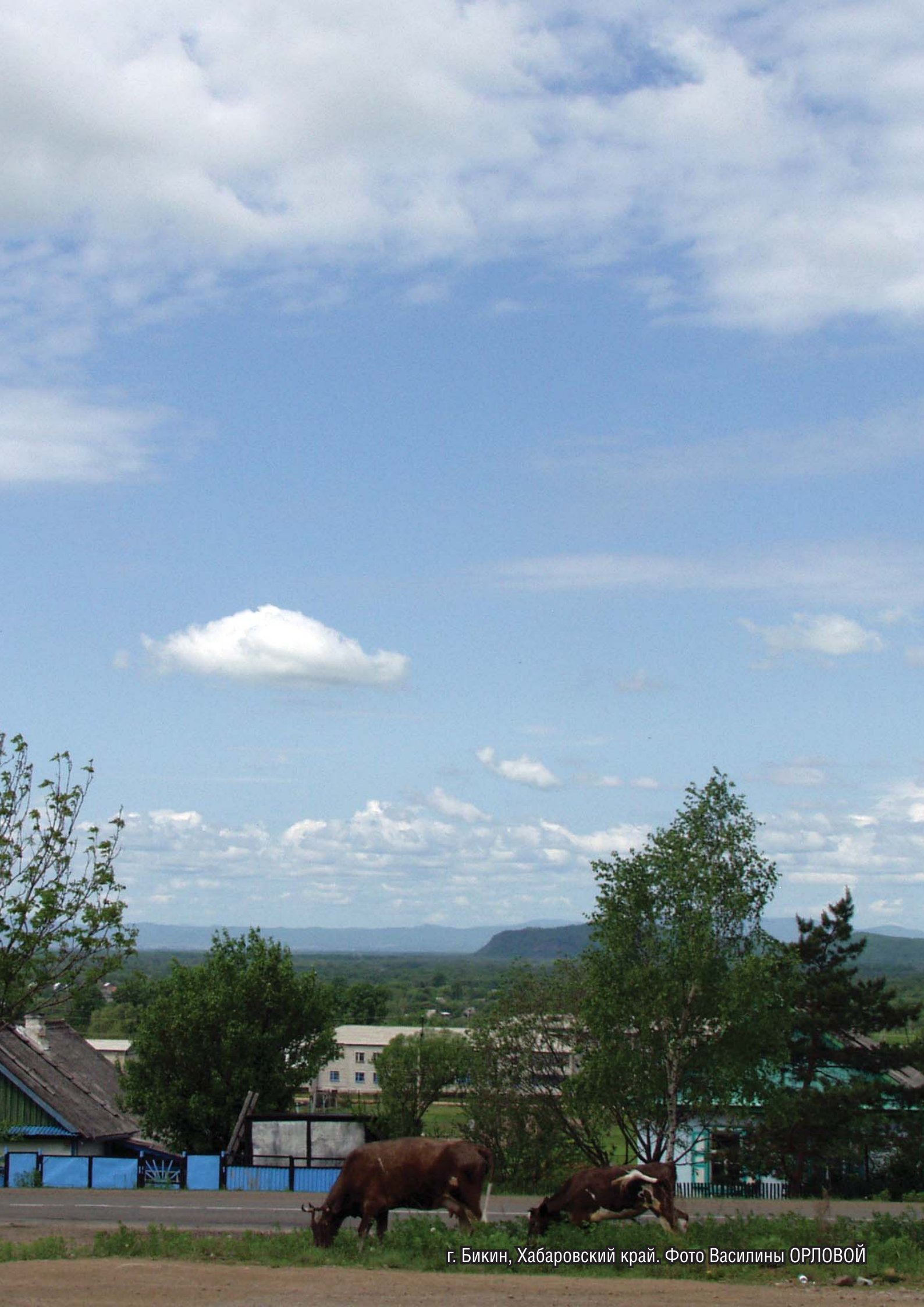
г. Бикин, Хабаровский край.