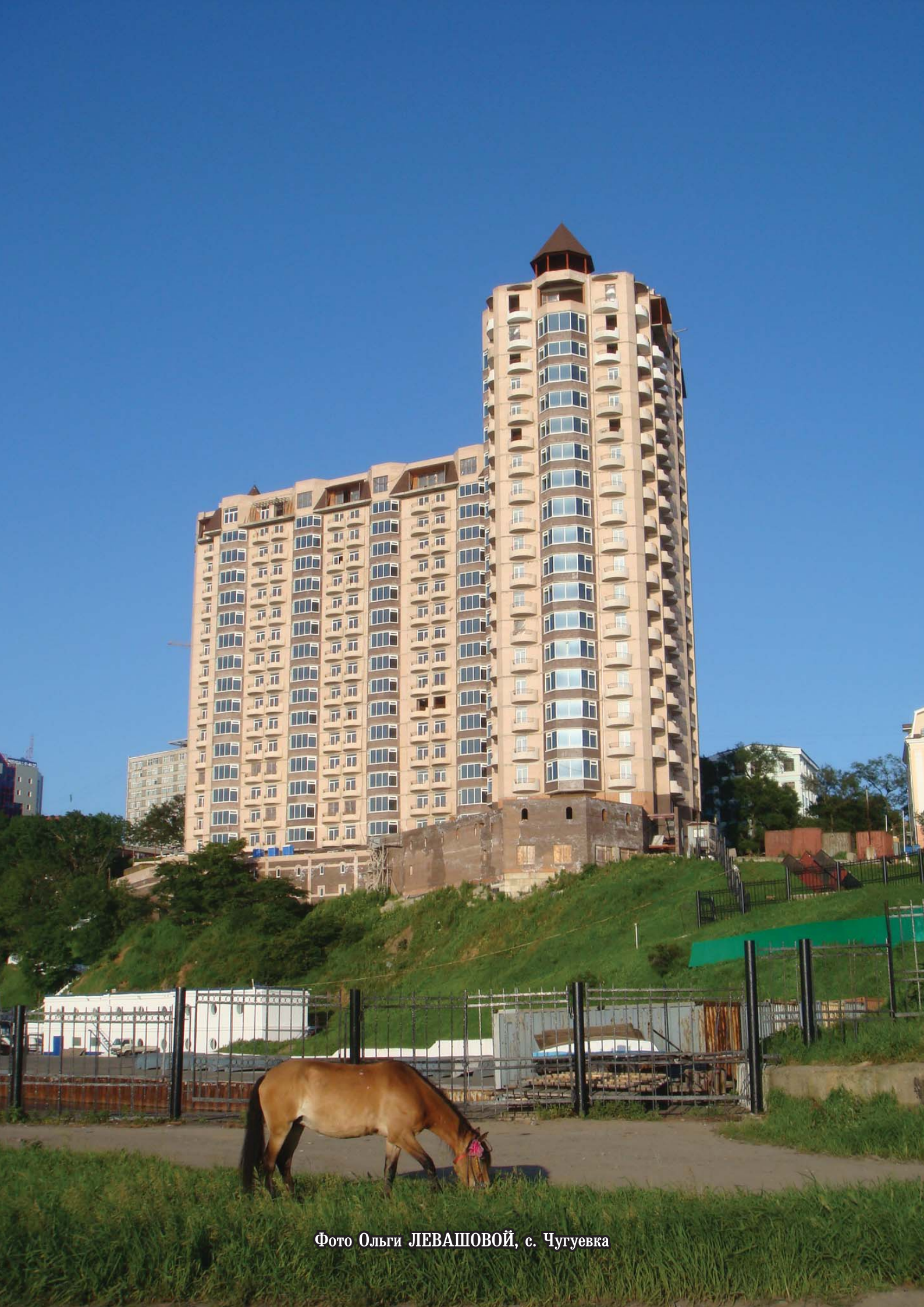
Фото Ольги ЛЕВАШОВОЙ, с. Чугуевка