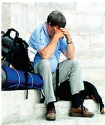
Фото для туроператора

договора на оказание туруслуг. В первую очередь обратите внимание на программу, маршрут путешествия, место размещения, организацию питания, перевозку, наличие экскурсовода, гида-переводчика и прочее. Такой договор является неотъемлемой частью